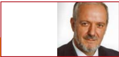
Bürgermeister Ernst Schilling, Stadt Herbolzheim