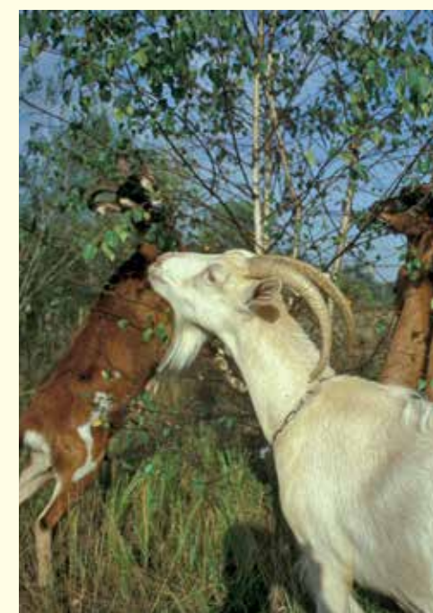
Ziegen fressen gerne Gehölze und erhalten so die wertvollen Sandrasen.

So werden die seltenen, wärme- und lichtliebenden Tier- und Pflanzenarten der Sandheiden und Dünen erhalten und gefördert.