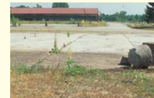
Ehemaliges Militärgelände mit Asphalt und Sandlebensräumen vor der Renaturierung (2004).

1861 wurde erstmals ein preußischer Schießstand im Niederwald erwähnt. 1909 wurden rund 62 Hektar Sandäcker außerhalb des Waldes enteignet, um im Mittelfeld und