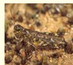
Gefleckte Keulenschrecke ( Myrmeleotettix maculatus ).