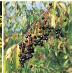
Späte Traubenkirsche ( Prunus serotina ).

Robinien kommen sehr gut mit unterschiedlicher Bodenfeuchte zurecht und breiten sich durch Wurzel- ausläufer in die Sandrasen aus. Ihre sehr langlebigen Samen können noch Jahrzehnte später wieder keimen.