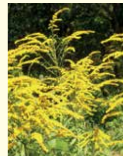
Riesen-Goldrute ( Solidago gigantea ).