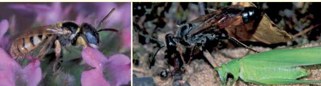
Links das Steppenbienchen ( Nomioides minutissimus ), rechts die Heuschrecken-Sandwespe ( Sphex funerarius ).

Im Sommer gräbt die Kreiselwespe ihre Nester 15 Zentimeter tief in den Sandboden und füttert ihre Larven in den Brutzellen. Eine Rarität ist das Steppenbienchen, das nur an sehr wenigen Stellen in Deutschland vorkommt. Es besucht die Blüten von Thymian und Berg-Sandglöckchen.