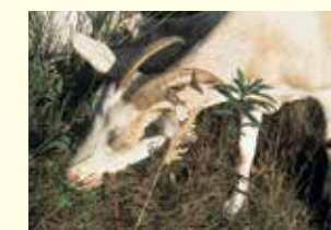
Ziegen als Landschaftspfleger.

Um die wertvollen Sandlebensräume zu erhalten, beweiden Ziegen die Flächen – sie fressen die Neophyten. An anderen Stellen werden die Gehölze gezielt entfernt und Golddruten vor der Blüte gemäht.