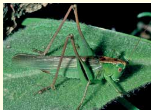
Ein langflügeliges Weibchen der Zweifarbigen Beißschrecke ( Metrioptera bicolor ).

Die Arten lassen sich wie Vögel an ihren Gesängen unterscheiden. Die meisten Heuschrecken erzeugen Töne mit Hilfe ihrer Flügel, wie die Zweifarbigte Beißschrecke, oder mit den Hinterbeinen, die sie an den Flügeln reiben, wie die Gefleckte Keulenschrecke.