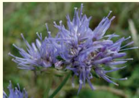
Sandglöckchen ( Jasione laevis ) gehören zu den Charakterarten der Sandheiden und Dünen.

Der „Dünen-Rundweg“ und der „Sandglöckchen-Weg“ führen Sie zu weiteren Schönheiten und Naturschätzen dieses Naturschutzgebietes. Speziell für die jungen Besucher des Gebiets gibt es außerdem noch den Lehrpfad „Mit Ziege Lisa zu den Sandrasen“.