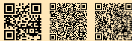
Naturschutz in BaWü | Schutzgebietssteckbrief | Themenpark Umwelt