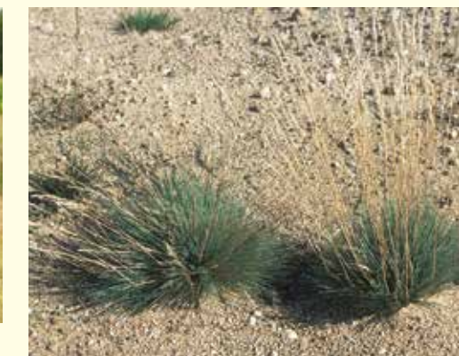
Silbergras ( Corynephorus canescens ) kennzeichnet die europaweit geschützten Sandrasen.

2004 wurde damit begonnen, die versiegelten Flächen zu entsiegeln und zu renaturieren, mit dem Ziel neue Sandlebensräume entstehen zu lassen, die Barriere zwischen Wald und Offenland aufzuheben, die Verbindungswege wieder zu öffnen und die Flächen der Natur zurückzugeben.