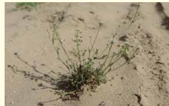
Bauernseuf ( Teesdalia nudicaulis ).

Naturschutzgebiet leben müssen. Nur gut angepasste Spezialisten kommen hier vor. Sie entwickeln besonders schmale Blätter, Wachsüberzüge und Haare gegen Verdunstung, Wasser speicherndes Gewebe oder besonders tief reichende Wurzeln. Viele Pflanzen sind einjährig, blühen und fruchten bereits im Frühjahr und umgehen als keimfähige Samen im Boden die besonders widrigen Bedingungen während der Sommerhitze.