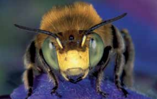
Ein Charaktertier der Sandrasen ist die Dünen-Pelzbiene ( Anthophora bimaculata ).