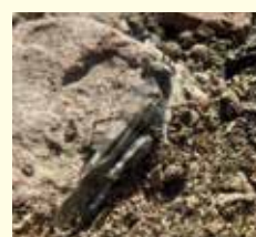
Blaufügelige Ödlandschrecke ( Oedipoda caerulea ).