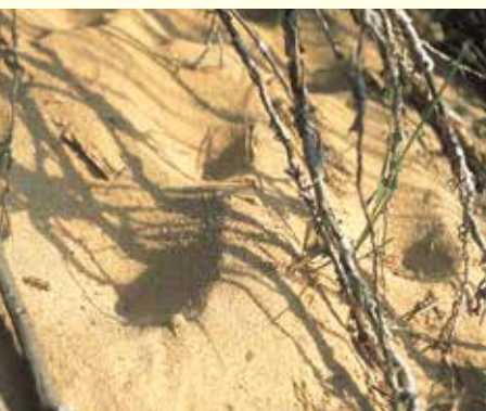
Dünen-Sandlaufkäfer ( Cicindela hybrida ).