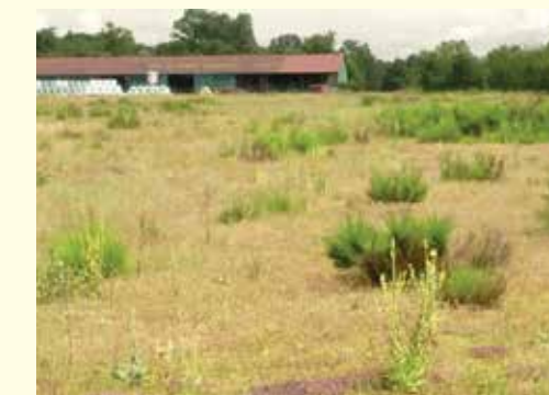
Nach der Renaturierung (Juli 2016): Die alte Militärhalle dient heute der Lagerung von Gerätschaften zur Landschaftspflege.

Oberfeld einen Übungsplatz für das deutsche Militär anzulegen, der von 1954 bis 1999 durch die französischen Streitkräfte als „Puységur-Gelände“ weiter betrieben wurde.