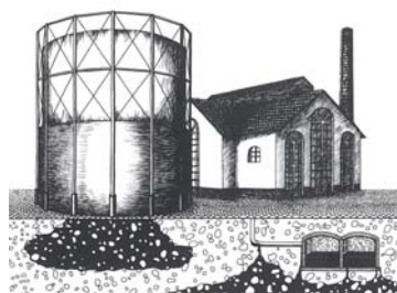
Abbildung 1: Gaswerkgrafik der LUBW - Symbol der 1990er Jahre

Seit 1987 werden im Land Baden-Württemberg die Umweltsünden aus der Vergangenheit aufgearbeitet. Mit der Bundes-Bodenschutz- und Altlasten-Verordnung aus dem Jahr 1999 wurden die dafür erforderlichen Methoden und Maßstäbe bundesweit vereinheitlicht. Unter Beteiligung der LUBW neu erarbeitete Werte für die Beurteilung von Grundwasser-Verunreinigungen mit bisher noch vernachlässigten, wasserlöslichen Teeröl-Inhaltsstoffen schließen hier eine Lücke (Tabelle 1).