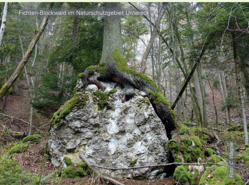
Fichten-Blockwald im Naturschutzgebiet Untereck

Das nach der FFH-Richtlinie besonders schützenswerte, stark gefährdete Grüne Koboldmoos ist ganz an diesen Waldtyp angepasst. Es wächst auf morschem Nadelholz, meist einzeln oder in kleinen Gruppen. Mit etwas Fantasie sehen die aufrechten, bauchigen Sporenkapseln aus der Nähe aus wie kleine grüne Männchen. Um dieses trockenheitsempfindliche Moos zu erhalten, müssen derartige Wälder mit einem hohen Totholzanteil dauerhaft geschützt werden.