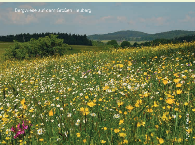
Bergwiese auf dem Großen Heuberg

Die Mageren Flachland-Mähwiesen und Berg-Mähwiesen nehmen gut ein Viertel der Fläche des FFH-Gebiets ein. Besucher erkennen die Artenvielfalt daran, dass die Blütenpracht dieser Wiesen besonders bunt mit wechselndem Farbenspiel erscheint. Einige dieser Wiesen sind als Relikte historischer Nutzungsformen ganz besonders schützenswert, wie die »Hülenbuchwiesen« nördlich von Tübingen. Sie wurden traditionell als Holzwiesen genutzt, das heißt, dass man an manchen Stellen die Gehölze stehen ließ und sie als Bau- oder Brennholz für den Eigenbedarf nutzte. Diese bis heute erhaltenen lockeren Baum- und Heckengruppen verleihen dem Gebiet einen bezaubernden, parkartigen Charakter.