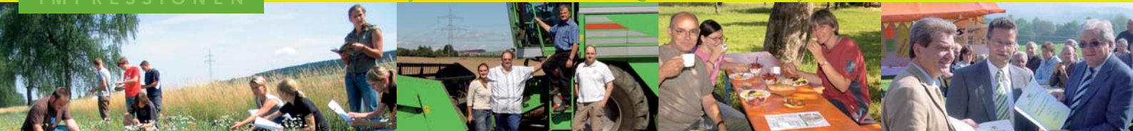
Minister Hauk u. die Landräte Widmaier und Hämmerle