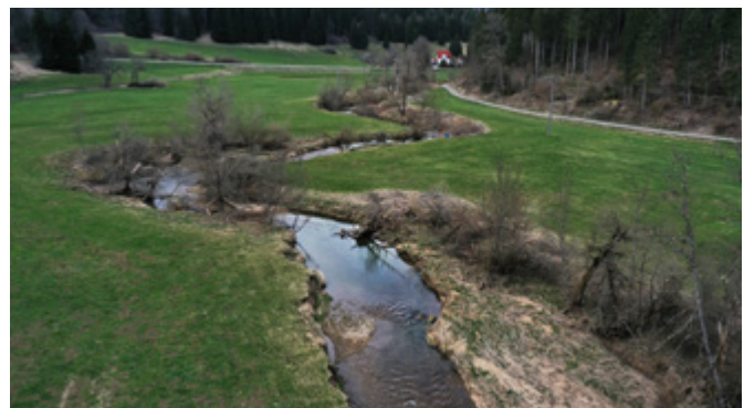
Laufentwicklung der Baera [BaF]

Um die Ziele der Wasserrahmenrichtlinie (WRRL) zu erreichen, ist es eine zentrale Aufgabe, die Lebensraumfunktion unserer Gewässer wiederherzustellen. Dazu müssen die Fließgewässer vor allem in ihrer Struktur naturnaher gestaltet werden. Hierzu werden in der Landesstudie Gewässerökologie Maßnahmenkonzeptionen für strukturell defizitäre Gewässerstrecken innerhalb des WRRL-Teilnetzes erstellt. Die Gewässerentwicklungsflächen stellen hierbei eine wichtige Grundlage dar.