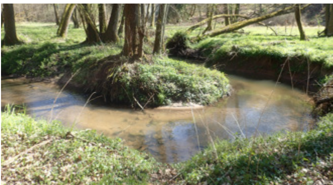
Natürliche Laufentwicklung der Glems im Unterlauf [BaF]

Die Bereitstellung und Sicherung von Flächen stellt eine wesentliche, aber auch schwierige und zumeist langfristige Aufgabe dar. Daher muss die Sicherung der notwendigen Flächen frühzeitig geplant und umgesetzt werden. Aus diesem Grund ist es meist sinnvoll, zum Verkauf stehende Grundstücke zum Zwecke eines späteren Tausches zu erwerben. Neben den rechtlichen Vorgaben zum Flächenerwerb sind dabei auch die haushaltsrechtlichen Vorgaben zu beachten.