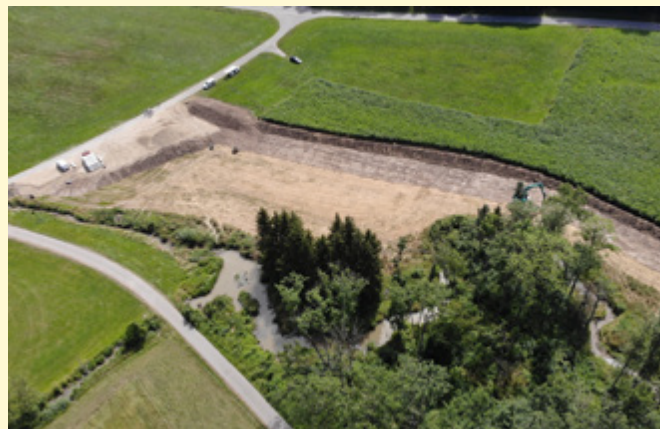
Baustelle am Unterlauf des Tobelbachs

Im Gegenzug konnten die von der Gemeinde Uttenweiler innerhalb des Flurneuordnungsverfahrens erworbenen Flächen mit den bereits im Eigentum befindlichen Flächen arrondiert und in die Gewässerentwicklungszone gelegt werden. Der Grunderwerb wurde dabei durch die uFB durch Moderation und den Abschluss von Landabfindungsverzichten aktiv unterstützt. Diese Bodenordnung ermöglicht u. a. die Entwicklung der Aue unter dem Einfluss des Bibers, den Erhalt des ökologischen Zustandes gemäß Wasserrahmenrichtlinie sowie die Verbesserung des natürlichen Hochwasserrückhalts in der Fläche.