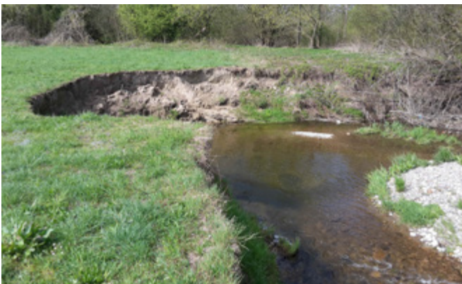
Raumgreifende Entwicklung des Bollenbachs

Fließgewässer sind dynamische Systeme. Durch das wechselnde Abflussgeschehen im Gewässer verändern sich räumlich und zeitlich Strukturen und damit die Lebensräume. Fortlaufende Erosions- und Sedimentationsvorgänge führen zu Umlagerungen der Sohle. Dadurch ergibt sich eine große Strukturvielfalt in immer wieder wechselnder räumlicher Verteilung.