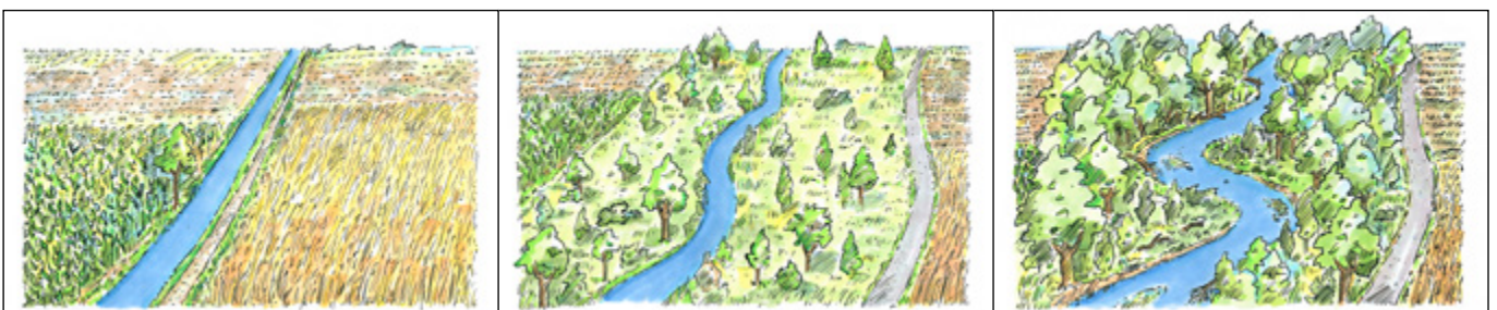
Vom begradigten zum vitalen Gewässer [Maerzke Design]

Während im steilen Oberlauf die Erosion überwiegt, befindet sich der Mittellauf im Wesentlichen in einer dynamischen Gleichgewichtslage. Im gefällearmen Unterlauf dominiert die Sedimentation. Die potenziell für eine natürliche Gewässerentwicklung erforderliche Fläche kann, falls kein historisches Kartenmaterial verfügbar ist, in Abhängigkeit von Gefälle, Talform und Lauftyp ermittelt werden. Hierzu werden die potenziell natürliche Gewässerbreite und der typspezifische Windungsgrad des Gewässerabschnittes hergeleitet (siehe Kapitel 3.3 [LUBW 2019.10]). Heute ist die natürliche Laufentwicklung oft durch