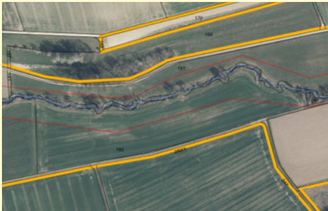
Geplante Gewässerentwicklungsfläche (rote Linien) [Landratsamt Biberach, Flurneuordnungsamt]

Das Ziel der Flurneuordnung Uttenweiler-Oberwachingen (Tobelbach) ist es, den Konflikt zwischen der landwirtschaftlichen Nutzung und den natur- und wasserwirtschaftlichen Erfordernissen entlang des Tobelbachs nachhaltig aufzulösen. Hierzu wurde auf einer Länge von rund drei Kilometern entlang des Gewässers 2. Ordnung ein zwischen 30 und 60 Meter breiter Korridor als Gewässerentwicklungszone geschaffen. Neben der Überführung der Nutzflächen in der Gewässerentwicklungszone in öffentliches Eigentum bestand die große Herausforderung darin, die häufig durch Biberdämme überfluteten flachen Uferbereiche von den landwirtschaftlichen Produktionsflächen zu trennen.