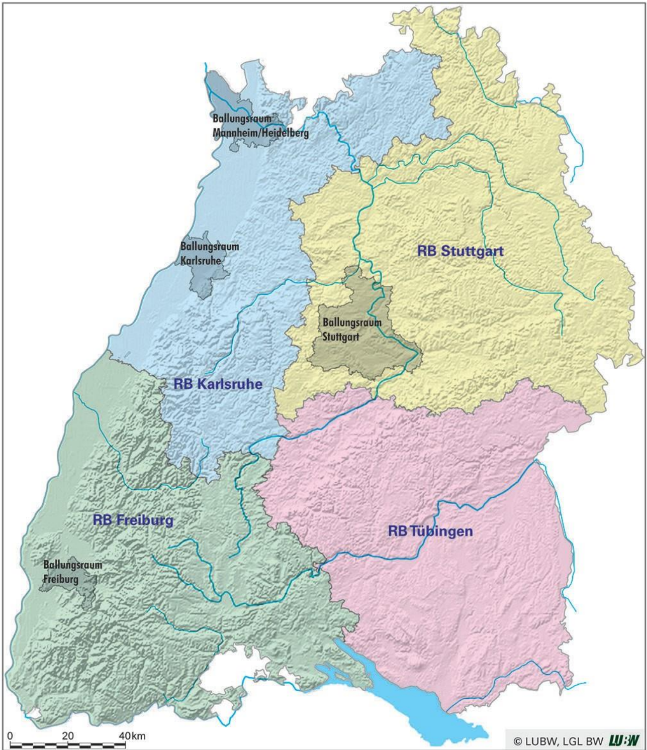
Abbildung 1-1: Regierungsbezirke und Ballungsräume in Baden-Württemberg