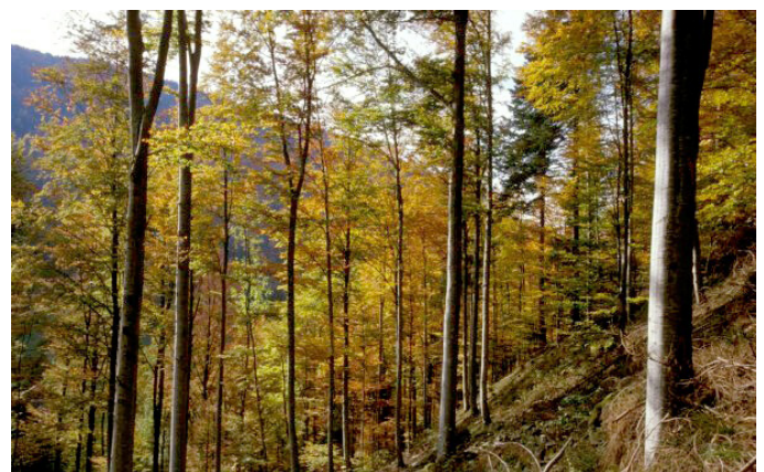
LRT 9110 im NSG Feldberg

Naturschutzfachlich bedeutsam sind insbesondere naturnahe Hainsimsen-Buchenwälder mit weitgehender, dem Naturraum entsprechender Übereinstimmung von Baumartenzusammensetzung, Bodenvegetation und Standort. Für den Artenschutz sind vor allem die flechten- und moosreichen Bestände auf nährstoffarmen, ausgehagerten Standorten wichtig. Hainsimsen-Buchenwälder sind teilweise nach Landesnaturschutzgesetz (NatSchG) bzw. Bundesnaturschutzgesetz (BNatSchG) oder § 30a Landeswaldgesetz geschützt.