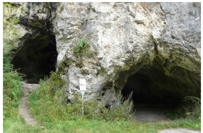
Höhle im Lonetal (C. Wagner)

Höhlen sind Zeugnisse der Erdgeschichte. Sie stellen schützenswerte Geotope dar und sind daher auch mit ihrem gesamten Inventar zu erhalten. Sie sind Lebensraum einer sehr eng angepassten Fauna, wie Spinnen und Krebse, z.B. die Blinde Höhlenassel ( Asellus cavaticus ). Höhlen sind nach Landesnaturschutzgesetz (NatSchG) bzw. Bundesnaturschutzgesetz (BNatSchG) geschützt.