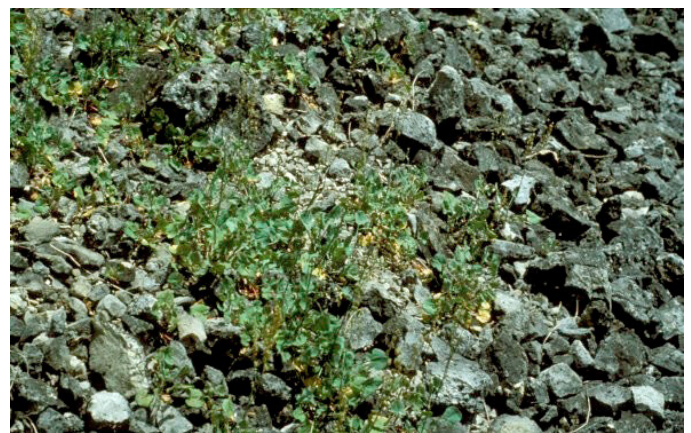
Hochmontane Silikatschutthalde im NSG Stiegelesfels (M. Witschel)

Die offenen natürlichen Gesteinshalden bieten verschiedene Standortbedingungen für viele hochspezialisierte, hochgradig gefährdete Arten wie z.B. den Krausen Rollfarn. Silikatschutthalden sind nach Landesnaturschutzgesetz (NatSchG) bzw. Bundesnaturschutzgesetz (BNatSchG) geschützt.