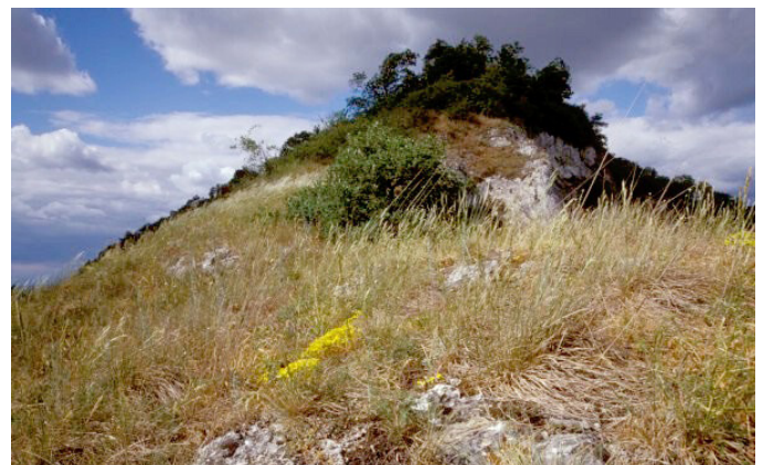
LRT 6110 im NSG Isteiner Klotz (M.Witschel)

Bei diesem seltenen Lebensraumtyp handelt es sich meist um Primärbiotope, die von Natur aus sehr kleinflächig an besonnten Felsstandorten vorkommen. Kalk-Pionierrasen bieten vielen gefährdeten Tier- und Pflanzenarten einen Lebensraum, was die besondere naturschutzfachliche Bedeutung dieses Lebensraumes unterstreicht. Unter diesen Tier- und Pflanzenarten sind insbesondere solche zu finden, für die in der Kulturlandschaft keine geeigneten Habitate zur Verfügung stehen. Kalk-Pionierrasen sind nach Landesnaturschutzgesetz (NatSchG) bzw. Bundesnaturschutzgesetz (BNatSchG) geschützt.