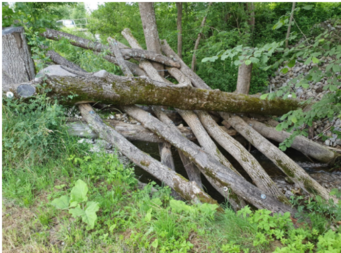
naturnaher Grobrechen in der Starzel [Büro Heberle]

Bei der aufgelösten Bauweise werden die Holzstämme leicht schräg liegend angeordnet. Die Auflage erfolgt auf einem oben quer liegenden Kopfstamm, der seitlich in die Böschungen eingebunden wird. Darauf aufgelegt werden mit unterschiedlichen Abständen die „Rechenstämmе“. Werden die Stämme untereinander verkeilt, erhöht sich die Stabilität. Eine Verankerung mittels verschraubter Gewindestangen ( d > 20 \text{ mm} ) oder Drahtseilen ( d > 20 \text{ mm} ) steifen das Rechengebilde aus.