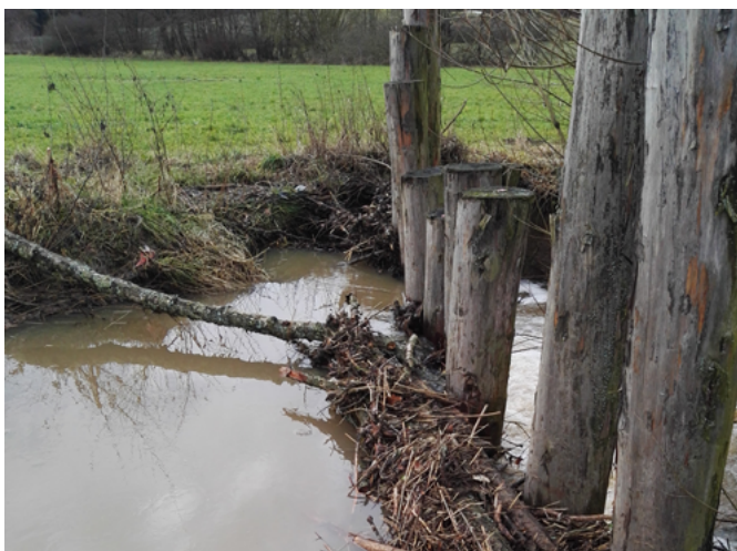
technische Grobrechen im Krebsbach und im Reichenbach [Büro Heberle]

Bei Bedarf kann die Pfahllänge, die Pfahlzahl und der Pfahlabstand über den Querschnitt variieren, je nachdem, welche Totholzfraktionen zurückgehalten werden sollen (Stämme, Äste, ...).