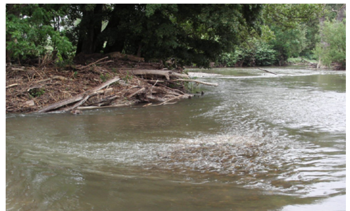
Totholz als wichtige Gewässerstruktur [RP Freiburg]

Eine regelmäßige Kontrolle des Grobrechens ist erforderlich. Das angefallene Treibgut ist regelmäßig zu entnehmen, um die Funktionsfähigkeit des Grobrechens zu erhalten. Das entnommene Treibgut ist als Abfall einzustufen. Ggf. kann der Holzanteil, z. B. in Holzschnitzelanlagen, verwertet werden. Die Zugänglichkeit muss auch für schweres Gerät möglich sein. Daher sind eine Zuwegung sowie eine stabile Aufstellfläche seitlich am Gewässerrand vorzusehen.