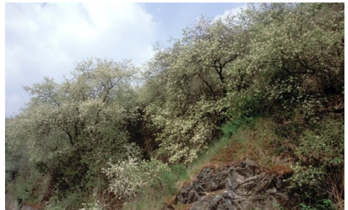
Felsenkirsche ( Prunus mahaleb )

Der Lebensraum ist in Baden-Württemberg sehr selten und nach Landesnaturschutzgesetz (NatSchG) bzw. Bundesnaturschutzgesetz (BNatSchG) geschützt.