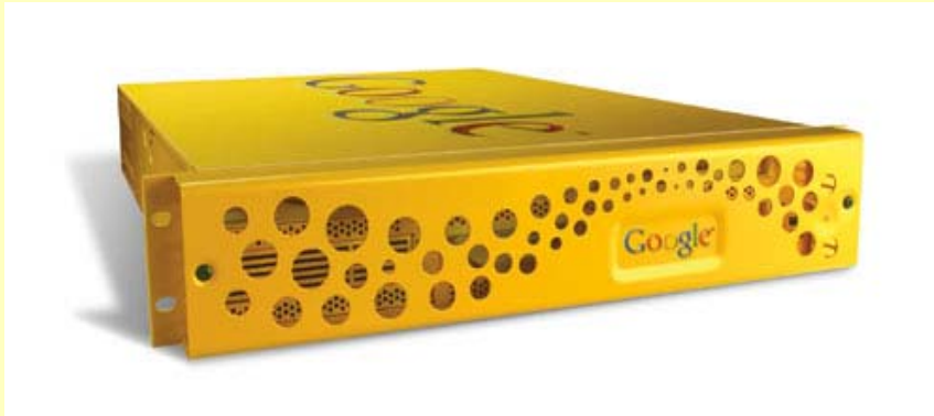
Google Search Appliance; © picasa.google.de