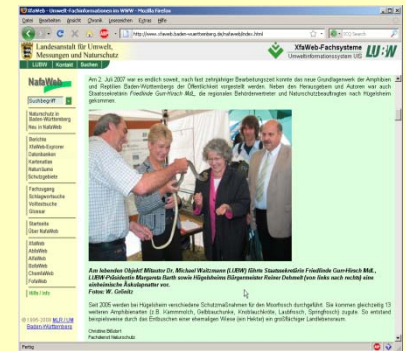
Fachsysteme (z.B. Fachdokumente)