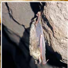
Großes Mausohr beim Winterschlaf

Die Linkenboldshöhle bei Albstadt-Onstmettingen ist eine der größten im FFH-Gebiet und kann als Schauhöhle besichtigt werden. In der rund 140 Meter langen Höhle haben sich beeindruckende Tropfsteine und leuchtend weiß-gelbe Kalksinterüberzüge gebildet, die leider zum großen Teil in der Vergangenheit beschädigt oder zerstört wurden. Im Winter ist die Höhle zum Schutz überwintender Fledermäuse verschlossen, denn jede Störung kann die schlafenden Tiere aufschrecken und dazu führen, dass die überlebenswichtigen Fettreserven nicht bis zum Frühjahr reichen. Nur Experten dürfen die Höhle dann betreten, um schlafende Fledermäuse zu zählen und zu bestimmen.