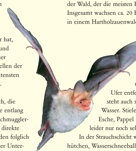
Die bedrohte Bechstein-Fledermaus (Myotis bechsteini) mag strukturreiche, feuchte Laubmischwälder / La chauve-souris menacée, le vespertilion de Bechstein (Myotis bechsteini) recherche des forêts humides bien structurées de feuillus

Gedüngt wurden sie von den Hochwassern des Rheins. Zwar liegt die Hartholzaue etwas höher und auch einige Meter weiter vom Ufer entfernt als die Weichholzaue, dennoch steht auch sie bis zu drei Monate im Jahr unter Wasser. Stieleiche, Linde, Spitz- und Bergahorn, Esche, Pappel und (wegen des Ulmensterbens) leidet nur noch selten, Ulmen bilden die Baumschicht. In der Strauchschicht wachsen Weißdorn, Hasel, Pfaffenhütchen, Wasserschneeball,