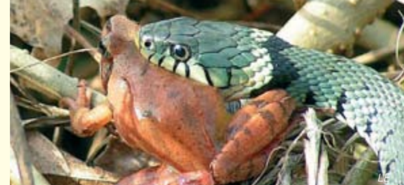
Die wasserliebende Ringelnatter mag die Auen und deren großes Nahrungsangebot/La couleuvre à collier, inféodée aux milieux humides, affectionne les zones alluviales et la richesse de leurs disponibilités alimentaires.