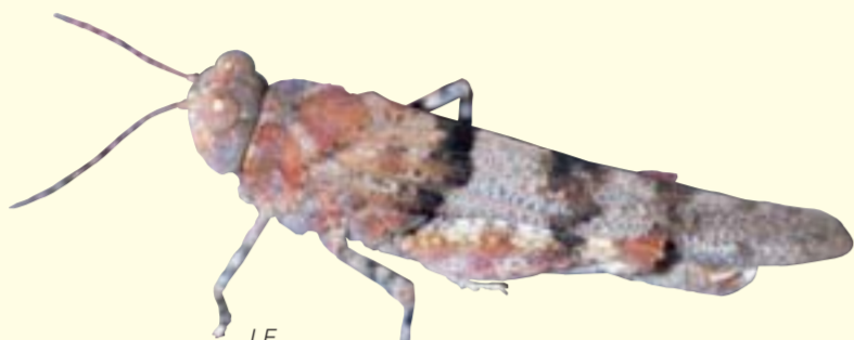
Die Blauflügelige Sandschrecke (Sphingonotus caeruleus) lebt auf sandigen vegetationsarmen Böden am Fuß der Dämme/L'œdipode azurée (Sphingonotus caeruleus) recherche les sols sableux à végétation éparse au pied des digues

Auch wenn es ein Widerspruch zu sein scheint: Einst waren Trockenrasen in den feuchten Rheinniederungen häufig. Die sandigen, nährstoffarmen Böden boten an den etwas höher gelegenen, sonnenexponierten Stellen ideale Bedingungen für eine von trockenheitsliebenden Orchideen dominierte Pflanzengesellschaft. Heute bestimmen vielfach riesige Monokulturen aus Mais das Landschaftsbild. Aber ausgerechnet eine von Menschenhand geschaffene Struktur bietet zumindest einem Teil der einstigen Trockenrasenbewohner Asyl, die Rheinhochwasserdämme. Stark besonnt, trocken und vor allem nährstoffarm, geben sie einem Halbtrockenrasen alles, was er zum Gedeihen braucht und wer im Sommer auf den Schutzdämmen entlang wandert, der sieht und riecht schnell: