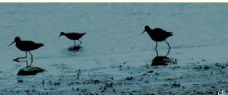
Limikolen (=Wadvögel) auf Futtersuche/L'limicole en quête de nourriture

Wie die Weichholzaunen sind sie also von wechselnden Wasserständen abhängig. Eine Weichholzaune entsteht aber in Jahrhunderten und sie vergeht, wenn das Hochwasser ausbleibt – in Jahrzehnten. Eine Schlammröhre entsteht und verschwindet innerhalb weniger Wochen oder Monate.