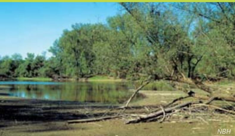
Lebensraum auf Zeit, die Schlammbank/Habitats temporaires, les bancs de vase