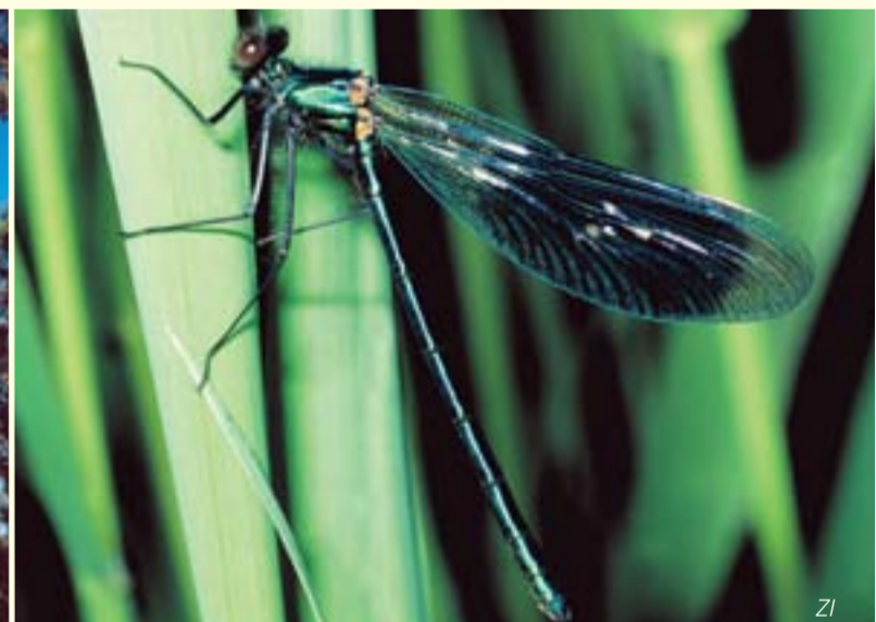
Für viele Libellen wie die Gebänderte Prachtlibelle (Calopteryx splendens) sind Altrheinarme ein Paradies / Les bras morts sont un paradis pour nombre de libellules telles le Calopteryx éclatant (Calopteryx splendens)

Den Luftraum über dem Wasser bevölkern die Kleinodien der Lüfte: Hellblaue Azurjungfern, kobaltblaue Prachtlibellen, rote Adonislibellen, grün schillernde Smaragdlibellen, farbenprichtige Mosaikjungfer und Königslibellen. Tief verborgen im Wasser aber, da leben Tiere von denen die meisten Menschen nicht einmal die Namen kennen: Rapfen, Steinbeißer, Groppe und Schlammpeitzger heißen einige der vielen Fischarten der Altrheinarme.