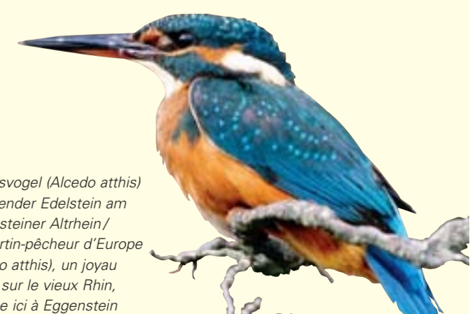
Der Eisvogel (Alcedo atthis) – fliegender Edelstein am Eggensteiner Altrhein / Le martin-pêcheur d'Europe (Alcedo atthis), un joyau volant sur le vieux Rhin, comme ici à Eggenstein

Den Luftraum über dem Wasser bevölkern die Kleinodien der Lüfte: Hellblaue Azurjungfern, kobaltblaue Prachtlibellen, rote Adonislibellen, grün schillernde Smaragdlibellen, farbenprichtige Mosaikjungfer und Königslibellen. Tief verborgen im Wasser aber, da leben Tiere von denen die meisten Menschen nicht einmal die Namen kennen: Rapfen, Steinbeißer, Groppe und Schlammpeitzger heißen einige der vielen Fischarten der Altrheinarme.