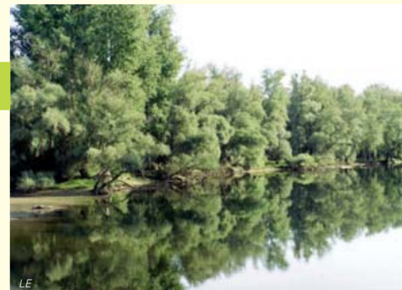
Silberweiden – die Charakterarten der Weichholzaue / Le saule blanc, espèce caractéristique de la forêt à bois tendre