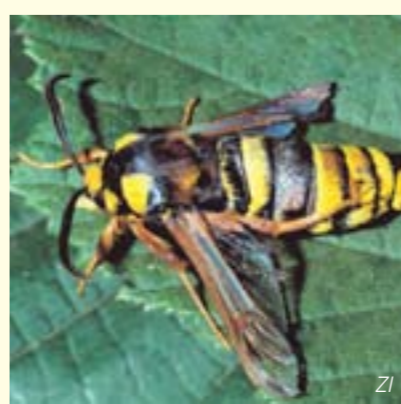
Auf Pappeln angewiesener Täuschungskünster der Auen – der harmlose Hornissenschwärmer (Sesia apiformis) / Expert en camouflage, le papillon frelon (Sesia apiformis), inoffensif, dépend des peupliers dans les forêts alluviales.

Vor allem Weidenarten, allen voran die schönen Silberweiden, prägen die Weichholzaue. In ihren oft mit Höhlen durchsetzten Stämmen, brüten Vögel wie der Fliegenschäpper und der Kleinspecht. In den Kronen ist beispielsweise der wunderschöne Pirol zuhause. Die vielen Totholz-Inseln sind wichtige Kinderstuben für viele auf Altholz angewiesene Vogel-, Fledermaus-, Käfer- und Pilzarten und nicht zuletzt ist die Weichholzaue auch wichtiger Lebensraum für Amphibien.