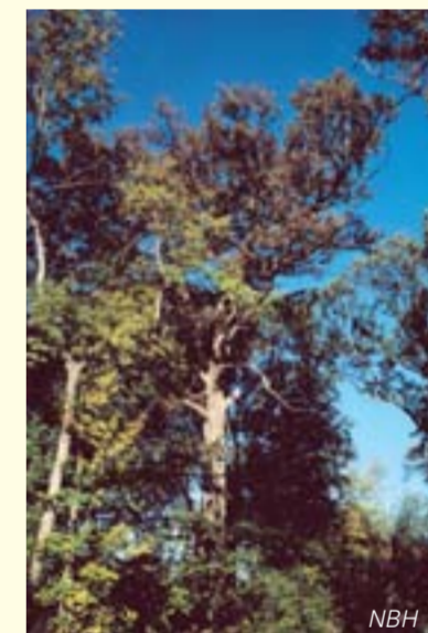
Der artenreichste Wald Mitteleuropas – der bedrohte Eichen-Ulmen-Auenwald / La forêt dont la biodiversité est la plus riche d'Europe: la chênaieormiale des zones alluviales

Kreuzdorn und Hartriegel. Eines haben Hart- und Weichholzaue gemeinsam: Den hohen Anteil an Tot- und Altholz. Und der ist elementar für das Überleben einer ganzen Insektengruppe: Die so genannten Holzkäfer. Weit mehr als die Hälfte dieser auf alte, sterbende oder tote Bäume angewiesenen Käfer sind vom Aussterben bedroht. Daneben ist die Hartholzaue Kinderstube für zahlreiche Höhlenbrüter. Wespenbussard und Schwarzer Milan brüten in ihrem Laubdach und vom Siebenschläfer, über verschiedene Fledermausarten bis hin zu Dachs oder Iltis bieten naturnahe Hartholzauen ideale Lebensbedingungen für die meisten der heimischen Säugetierarten. Allerdings wurde dieser an Edelholz reiche Wald nach dem Krieg an vielen Stellen abgeholzt. Das Holz ging als Reparationszahlungen nach Frankreich und auf den Kahlschlägen wurden schnellwachsende, aber einformige Monokulturen aus Hybridpappeln angepflanzt.