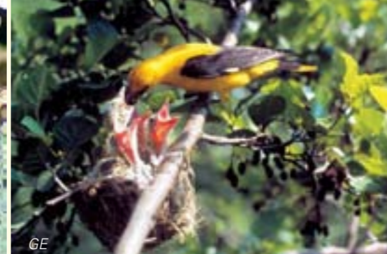
Vogel von tropischer Schönheit: der Pirol (Oriolus oriolus)/Un oiseau dont la beauté rappelle les Tropiques: le loriot d'Europe