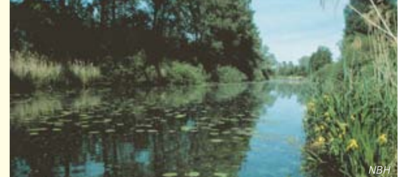
Eine Oase der Vielfalt: der Eggensteiner Altrheinarm | Une oasis de biodiversité: le bras mort