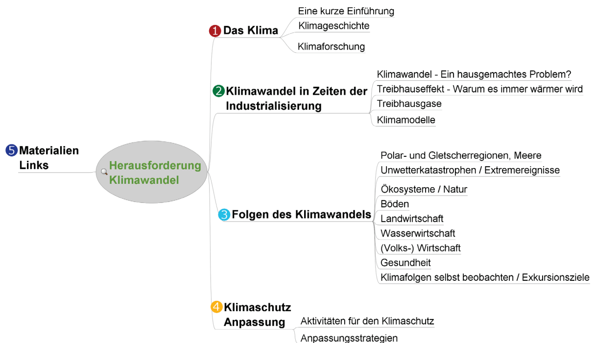
Abbildung 1: Gliederungskonzept für das Umweltthema „Umwelt und Klima“

In einem ersten Projektschritt wurde die inhaltliche Gliederung für den Themenkomplex Klimawandel und Klimaschutz entwickelt (s. Abbildung 1). Die thematischen Säulen bilden die vier Hauptthemen (1) Klima-Grundlagen, (2) Ursachen und (3) Folgen des anthropogenen Klimawandels sowie (4) Klimaschutz und Anpassung.