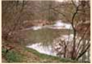
Hier ist die Rems ungebändigt.

Die Rems hat sich flussabwärts von Waiblingen tief in den Muschelkalk eingeschnitten und ein schlingenreiches Tal mit schroffen Prallhängen und sanften Gleithängen geformt. Die Flusswindungen bezeichnet man als Mäander. An der Außenseite eines Mäanders prallt der Fluss mit Wucht gegen die Talwand. Dort wäscht er Gestein aus und trägt es ab; ein steiler Prallhang entsteht. Dem Prallhang gegenüber liegt der flach geböschte Gleithang. Dort lagert der Fluss Geröll, Sand und Lehm ab. Bei Hochwasser werden Teile der Talaue überschwemmt; der Fluss spült dann Feinmaterial auf die Wiesen. Dass die untere Rems auch heute noch auf weite Strecken ein lebendiger Fluss ist, liegt daran, dass sie kaum begradigt und befestigt worden ist. Ständig formt und ändert sie selbst ihr Flussbett und stellenweise auch die Ufer.