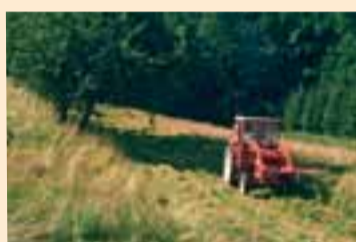
Die bunten Wiesen werden zweimal jährlich geschnitten.

Die Naturschutzverwaltung setzt sich für die Erhaltung der landschaftlichen Vielfalt im Unteren Remstal ein. Das bedeutet, dass die Natur in einigen Bereichen sich selbst überlassen wird, im Übrigen aber eine