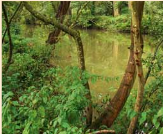
Der dichte Unterwuchs am Ufer bietet Deckung und Nistplätze.