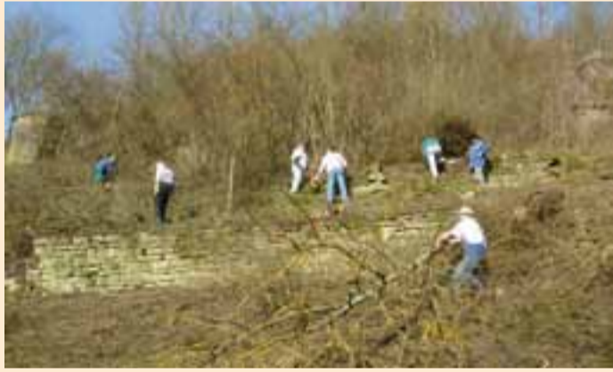
Pflegemaßnahmen in den aufgelassenen Weinbergterrassen