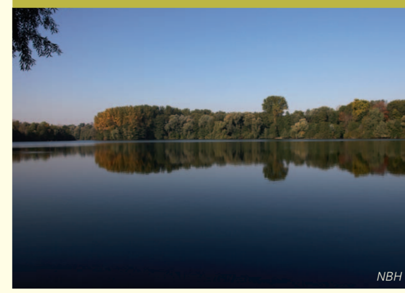
Ein von Menschen geschaffener Lebensraum für Wasservögel: der nördliche Teil des Grötzingen Baggersees

Das Naturschutzgebiet Weingartener Moor – Bruchwald Grötzingen umfasst den letzten größeren Rest der einst von einem Gewässersystem geprägten Flussniederung am östlichen Rand des Oberrheingraben. Kinzig-Murg-Rinne nennt man heute diese am Ende der letzten Eiszeit entstandene Niederung. Viele Bäche und Flüsse von der Kinzig im Süden bis zum Kraichbach im Norden speisten damals diese Flussniederung. Vor mehr als 6.000 Jahren durchbrachen Kinzig und Murg die Niedertrasse zum eigentlichen Rhein, die Flussniederung am östlichen Rand des Oberrheingraben verlor zwei ihrer größten Nebenflüsse und begann langsam zu verlanden. Aus der ehemals wilden Auenlandschaft wurde ein vom hohen Grundwasserstand geprägtes Mosaik aus Bruchwäldern, Moor- oder Sumpfböden und kleinen Seen. Mit der Rheinbegradigung im 19. und den vielen Entwässerungsmaßnahmen im 20. Jahrhundert nahm der Mensch endgültig Besitz von der Kinzig-Murg-Rinne. Heute findet man nur noch spärliche Spuren der ehemaligen Flussniederung. Kleine Bruchwaldreste bei Untergrombach beispielsweise, die Silzenwiesen bei Ubstadt oder das Stettfelder Bruch. Aber nur das Weingartener Moor lässt uns heute noch erahnen, wie die Umlandschaft am Rande des Rheintales einst aussah.