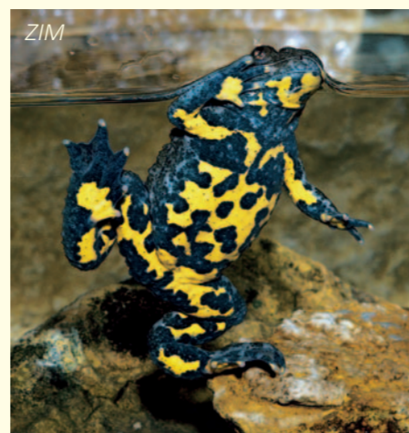
ZIM Gerät sie in Gefahr, präsentiert die Gelbauchunke ( Bombina variegata ) dem Angreifer ihre gelbschwarze Unterseite.

ermöglichen den Amphibien sowohl die gefahrlose Wanderung an ihre Laichgewässer als auch die Rückwanderung in die Bergwälder östlich der Bundesstraße 3. Dort verbringen die meisten Amphibien den Sommer, Herbst und Winter, bevor sie sich dann ab dem Vorfrühling wieder auf ihre gefährliche Wanderung in das Moor machen. Ab 2005 konnte mit kommunalen (Stadt Karlsruhe), Mitteln der Naturschutzverbände und Landesmitteln (Regierungspräsidium Karlsruhe und Stiftung Naturschutzfonds) die bestehende Amphibienschutzanlage weiter ausgebaut werden. Ohne die Schutzvorkehrungen mit ihren Leiteinrichtungen und Durchlässen und ohne die Arbeit vieler Naturschützer, die nach wie vor sehr viele Amphibien Jahr für Jahr über die Straße tragen, hätte der Autoverkehr diesem Jahrtausende alten Schauspiel längst ein Ende bereitet.