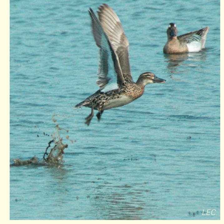
Im Herbst, wenn die Knäkenten (Anas querquedula) nach Süden ziehen, können sie von der Aussichtsplattform aus gut beobachtet werden.

Herausgeber Regierungspräsidium (RP) Karlsruhe, Referat 56 (Naturschutz und Landschaftspflege), 76247 Karlsruhe