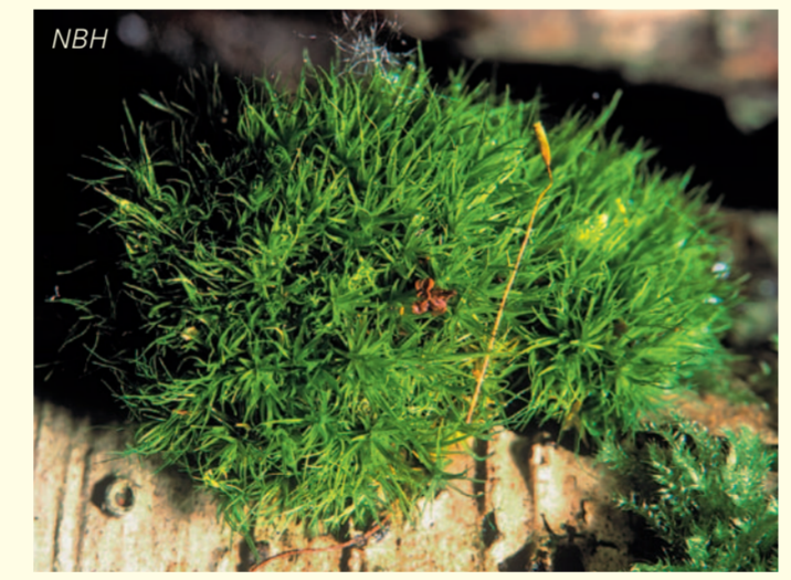
Das Grüne Besenmoos (Dicranum viride) ist eine unauffällige europaweit geschützte Rarität und wächst gerne an der Rinde alter Laubbäume.

fließend, aber generell gilt: Ist die Strauchvegetation dicht und artenreich, ist der Erlen-Bruchwald bereits stark gestört. Den hohen Grundwasserstand, auf den die Bruchwälder angewiesen sind, vertragen nämlich nur wenige Pflanzen.