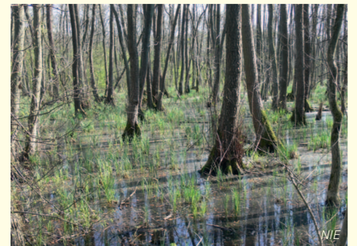
Hoher Grundwasserstand kennzeichnet den Bruchwald.

Der 1984 unter Naturschutz gestellte Grötzingen Bruchwald zählt gemeinsam mit dem benachbarten Bruchwald auf Weingartener Gemarkung zu den größten intakten Erlen-Bruchwaldgebieten in der alten Bundesrepublik. Das Grüne Besenmoos ist eine der Deutschland weit bedrohten Pflanzenarten, die dort wachsen. Der seltene Erlenzeisig lässt sich vor allem im Winter die kleinen Früchte der Schwarz-Erle schmecken. Allerdings ist der Erlen-Bruchwald nicht mehr überall intakt. An vielen Stellen macht sich der in den letzten Jahrzehnten gesunkene Grundwasserspiegel bemerkbar. An diesen trockeneren Stellen wachsen neben dem Charakterbaum des Bruchwaldes, der Schwarz-Erle, und ihrem Begleiter, der Esche, viele andere Laubbäume. Die Übergänge zwischen einem Erlen-Bruchwald und anderen feuchten Laubwaldgesellschaften sind