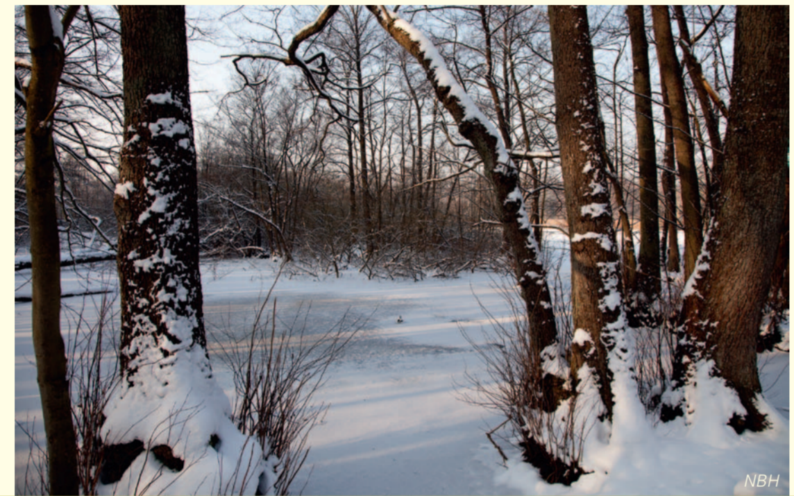
Ein Mosaik aus Bruchwäldern, Moorgebieten und kleinen Seen bestimmte einst das Landschaftsbild in der Kinzig-Murg-Rinne.

Natura 2000 ist das Naturschutzkonzept der Europäischen Union (EU) zur Erhaltung der biologischen Vielfalt in Europa. Grundlage ist ein grenzüberschreitendes Netz aus Gebieten mit natürlichen und naturnahen Lebensräumen, die europaweit seltene und bedeutende Pflanzen- und Tierarten der Fauna-Flora-Habitat- und der Vogelschutz-Richtlinie enthalten: die FFH- und Vogelschutzgebiete, gemeinsam auch Natura 2000-Gebiete genannt. Das Naturschutzgebiet „Weingartener Moor – Bruchwald Grötzingen“ ist Teil dieses europaweiten Schutzgebiets-Netzwerks.