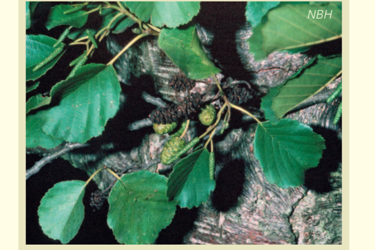
Blätter und Früchte der Schwarz-Erle (Alnus glutinosa)

Zwei Eigenschaften unterscheiden den Baum des Jahres 2003 von anderen heimischen Baumarten: Er lässt sich von Mikroorganismen mit Stickstoff versorgen und er steht gern im Wasser. Allerdings nur mit seinen Wurzeln. Im Gegensatz zu den Bäumen der Flussauen, die an einen steten Wechsel zwischen trocken und feucht angepasst sind, benötigt die Schwarz-Erle eher gleichbleibende Bedingungen. Trockenheit verträgt sie nicht, daher gedeiht sie nur auf Flächen mit einem gleichbleibend hohen Grundwasserstand. An die schlechte Luftversorgung bei hohem Wasserstand ist sie durch große Öffnungen und Luftkanäle in der Stammbasis und in den oberflächennahen Wurzeln angepasst. Die Versorgung mit Stickstoff übernehmen Mikroorganismen, die in Wurzelknöllchen symbiotisch mit der Schwarz-Erle zusammenleben. Diese Bakterien (Frankia alni) sind fähig, Stickstoffverbindungen direkt aus dem Stickstoff der Luft zu bilden. Als Gegenleistung versorgt die Schwarz-Erle sie mit Nährstoffen.