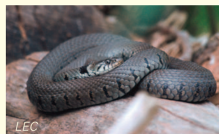
LEC Der Amphibienreichtum macht das Weingartener Moor zum Schlaraffenland für Ringelnattern.

ermöglichen den Amphibien sowohl die gefahrlose Wanderung an ihre Laichgewässer als auch die Rückwanderung in die Bergwälder östlich der Bundesstraße 3. Dort verbringen die meisten Amphibien den Sommer, Herbst und Winter, bevor sie sich dann ab dem Vorfrühling wieder auf ihre gefährliche Wanderung in das Moor machen. Ab 2005 konnte mit kommunalen (Stadt Karlsruhe), Mitteln der Naturschutzverbände und Landesmitteln (Regierungspräsidium Karlsruhe und Stiftung Naturschutzfonds) die bestehende Amphibienschutzanlage weiter ausgebaut werden. Ohne die Schutzvorkehrungen mit ihren Leiteinrichtungen und Durchlässen und ohne die Arbeit vieler Naturschützer, die nach wie vor sehr viele Amphibien Jahr für Jahr über die Straße tragen, hätte der Autoverkehr diesem Jahrtausende alten Schauspiel längst ein Ende bereitet.