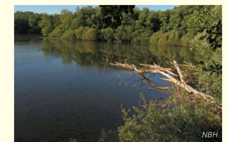
Der Flachwassersee im Kern des Naturschutzgebietes Weingartener Moor entstand durch Torfabbau.

Der Torfabbau im 19. Jahrhundert war eine wesentliche Grundlage für die Entstehung des Moorsees. Der Torf wurde hauptsächlich als Brennmaterial für Schnapsbrennereien verwendet. Nach Aufgabe des Torfabbaus kurz nach dem 1. Weltkrieg begannen sich die alten Torfstiche mit Wasser zu füllen. Der zentrale Moorsee verdankt seine Entstehung also auch dem Torfabbau. In den folgenden Jahrzehnten gefährdeten natürliche Verlandungsprozesse und andere Ursachen das offene Niedermoor. Die Schilfröhrichte gingen stetig zurück und die Wasserpflanzen-Flora verarmte zunehmend. In den achtziger Jahren des vergangenen Jahrhunderts wurden daher umfangreiche Pflegemaßnahmen durchgeführt, die dazu beitrugen die ökologisch besonders wertvollen Uferbereiche des Flachwassersees mit ihren Schilfbeständen, Weidengebüschen und die artenreiche Wasserpflanzen-Flora im See zu erhalten.