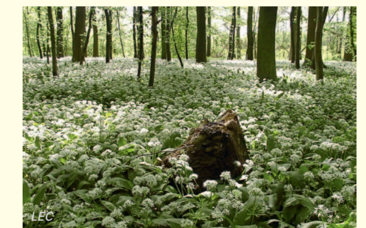
Im Frühjahr überzieht ein Blütenteppich aus Bärlauch (Allium ursinum) die feuchten Wälder des Naturschutzgebietes.

Die Umgebung des Schutzgebietes ist weitgehend geprägt von Agrarflächen und Verkehrswegen. Hecken, Gräben und andere vernetzende Landschaftsstrukturen, die Amphibien bei ihrer Wanderung zwischen Sommer- und Winterquartieren als Versteck dienen könnten, fehlen vor allem zwischen Berghangwald und Moor fast vollständig. Nur im Nordwesten zwischen dem Weingartener Gewerbegebiet und der Autobahn grenzen direkt an den Bruchwald feuchte Wiesen, Gräben und kleine Schilfbestände an. Diese außerhalb des Naturschutzgebietes liegenden Landschaftselemente sind Lebensräume für seltene Tiere und Pflanzen.