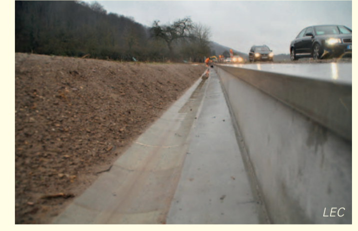
Die Amphibienleiteinrichtung ermöglicht Amphibien die Wanderung vom Winterquartier im Bergwald zu ihren Laichgewässern und verhindert so ein Amphibien-Massensterben auf der vielbefahrenen Bundesstraße.

So auch für viele der Amphibien, die jedes Frühjahr zum Laichen in das Weingartener Moor wandern. Für diese Tiere sind die Feuchtwiesen und Gräben am Rand des Naturschutzgebietes wertvolle Sommerlebensräume. Deshalb ist dieses nicht geschützte Gebiet enorm wichtig für den Amphibienbestand des Naturschutzgebietes. Aber auch für Vogel- und Libellenarten ist das ökologisch wertvolle Offenland die ideale Ergänzung zum benachbarten Bruchwald.