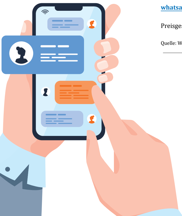
Illustration by Freepik

Quelle: Whatsapp gehört zum Facebook Konzern.