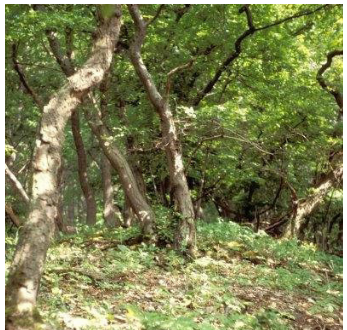
LRT 9170 - Labkraut-Eichen-Hainbuchenwald (R. Mast)

Als artenreicher Lebensraum hat er eine besondere Bedeutung für den Naturschutz. Auch in diesem Waldtyp stellen alte Eichen den Lebensraum für den Heldbock ( Cerambyx cerso ) dar und auch der Hirschkäfer ( Lucanus cervus ) findet entsprechende Lebensbedingungen vor. Beide Käfer sind in der FFH-Richtlinie als besonders schützenswerte Arten aufgeführt. Labkraut-Eichen-Hainbuchenwälder sind teilweise nach Landesnaturschutzgesetz (NatSchG) bzw. Bundesnaturschutzgesetz (BNatSchG) oder § 30a Landeswaldgesetz geschützt.