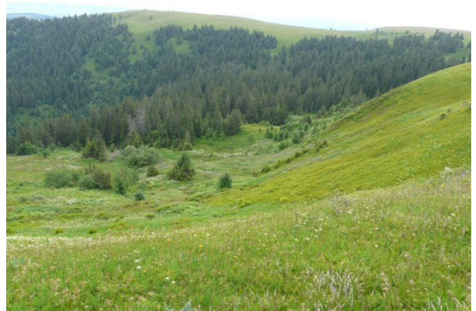
LRT 6150 am Feldberg

Aufgrund der isolierten Lage außerhalb der Hauptverbreitung sind die Vorkommen des Lebensraumtyps besonders selten und schützenswert. Boreo-alpines Grasland ist teilweise nach Landesnaturschutzgesetz (NatSchG) bzw. Bundesnaturschutzgesetz (BNatSchG) geschützt.