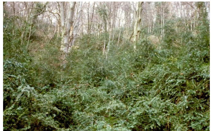
Buchswald bei Grenzach

Aufgrund des begrenzten Vorkommens und der Einzigartigkeit der Bestände ist der Lebensraumtyp besonders schützenswert. Buchsbaum-Gebüsche trockenwarmer Standorte sind nach Landesnaturschutzgesetz (NatSchG) bzw. Bundesnaturschutzgesetz (BNatSchG) geschützt.