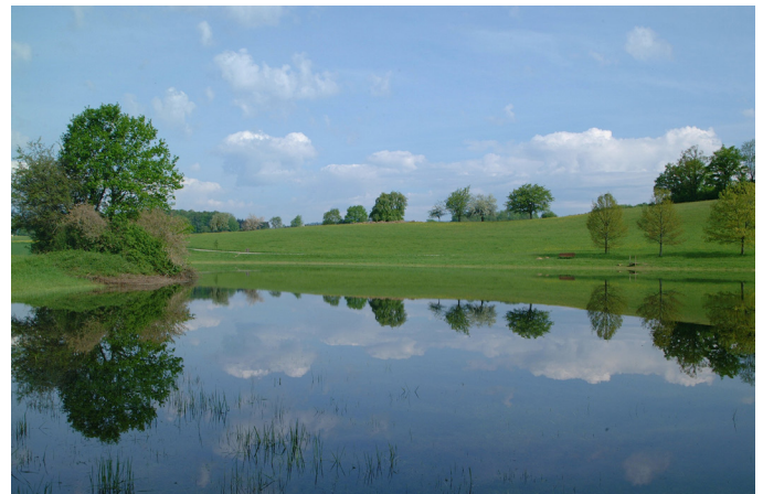
Eichener See (I. Schubert)

Die Bedeutung des Lebensraumtyps liegt in seiner Einzigartigkeit für Baden- Württemberg.